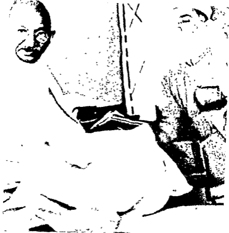
चित्र 1 : महात्मा गांधी के साथ डॉ. ज़ाकिर हुसैन